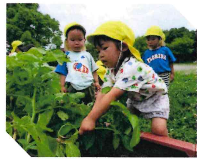
おいもがついてる