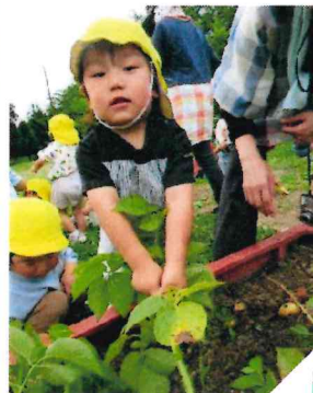
よいしょ ぬけないなあ