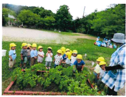
お話を聞いてから掘りました